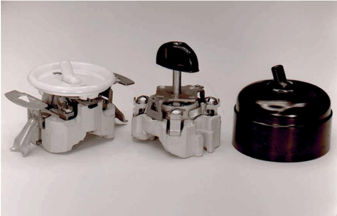
YLLÄ: Valokatkaisijoita Strömbergin mallistosta 1954.

tukseen ja kulunvalvontaan. Nuo esimerkit osoittavat, että nappuloiden automaatio kytkeytyy erityisesti julkisiin tiloihin. Kotitalouksissa ja monissa työtehtävissään käyttäjät joutuvat tekemään enemmän kytkimiin liittyvää manuaalista työtä.