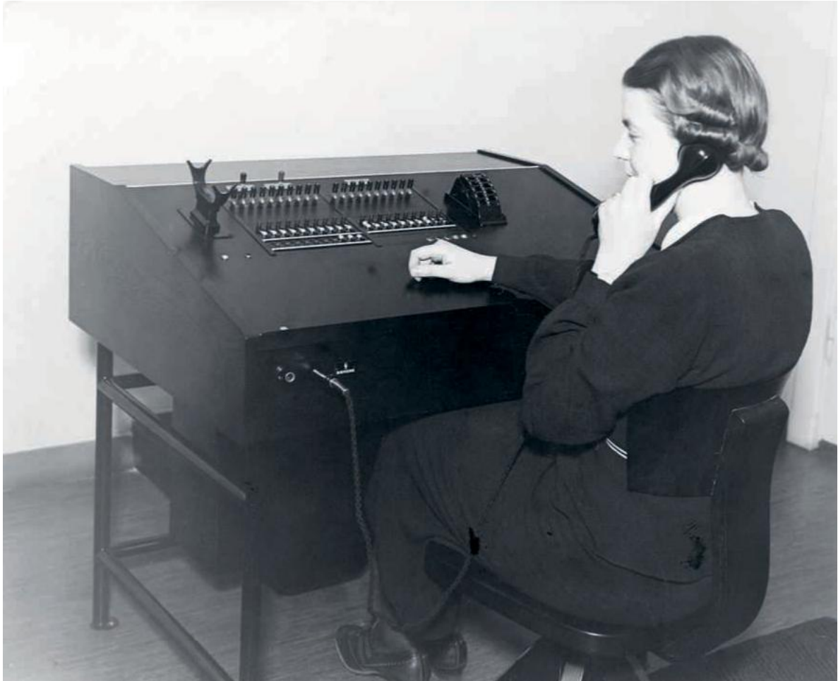
YLLÄ: Helsingin puhelinyhdistyksen puhelinvaihte 1938.

vältellä.” 39 Älykodin tietynlaiseksi vakiofraasiksi on muuttunut ajatus, että ihanekoti on sellainen, jossa saunan kiuas on ohjattavissa etäältä kännykän avulla, ja muutenkin kännykkä viestii erilaisista kodin tilanteista. Kännykästä on tullut nimenomaan suomalaisen teknologikulttuurin avainkoje, koska siihen kulminoituu Nokia-yhtymän kautta kansallinen selviytymistarina 1990-luvun lamasta ja toisaalta 2000-luvun alun hukatut mahdollisuudet ja uusi taloudellinen taantuma.