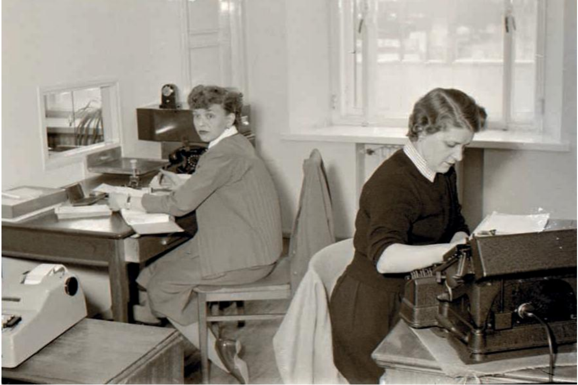
YLLÄ: Toimistotyötä Strömbergin Helsingin osastolla 1950-luvulla.