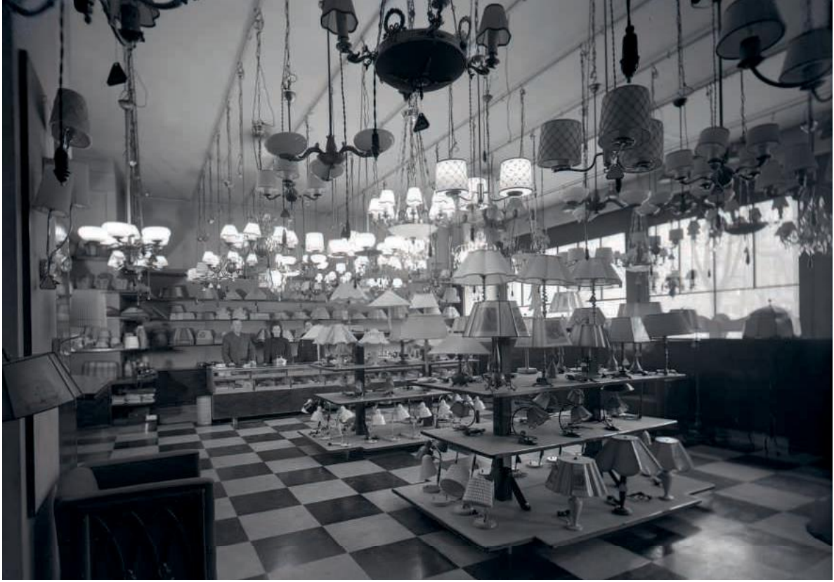
YLLÄ: Strömbergin Helsingin myymälä 1949.